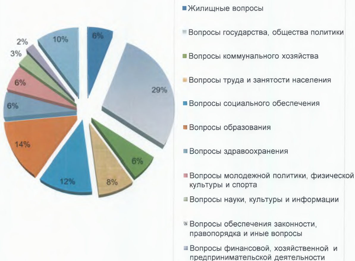
Количество обращений, поступивших в адрес депутата Тюменской областной Думы Н.А. Руссу

По итогам рассмотрения всех обращений из 47 поступивших, 47 заявлений рассмотрено, из них 19 (40,4 %) поднимаемых в обращениях вопросов решены положительно, на 28 обращений (59,5%) даны компетентные разъяснения.