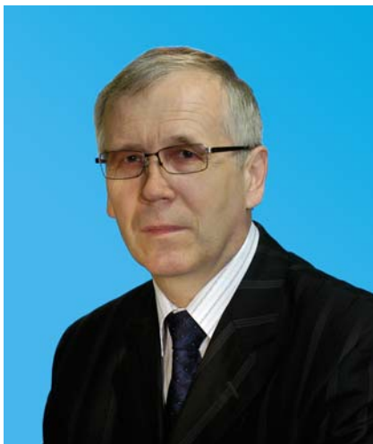
Депутат Тюменской областной Думы по избирательному округу № 8 город Сургут, Сургутский район