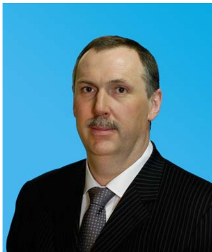
Депутат Тюменской областной Думы от Тюменского регионального отделения партии «Единая Россия»