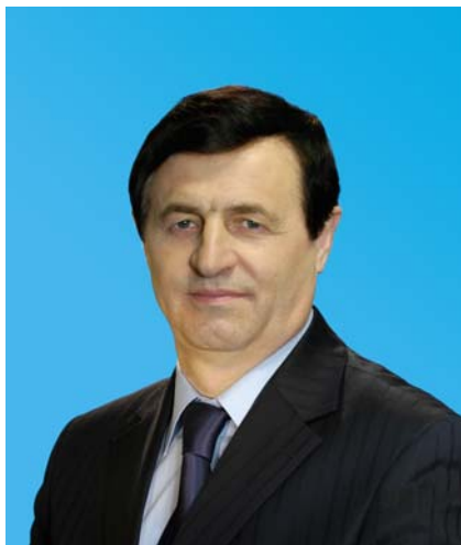
Депутат Тюменской областной Думы от Тюменского регионального отделения партии «Единая Россия»