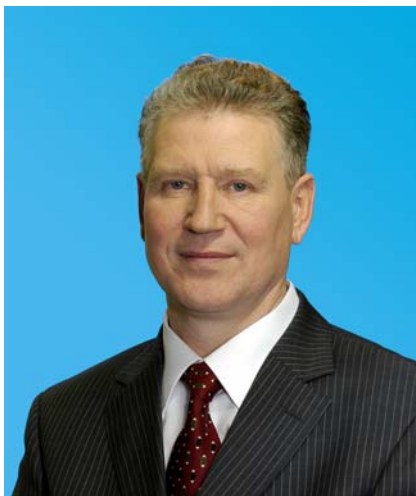
Депутат Тюменской областной Думы по избирательному округу № 14 город Тюмень