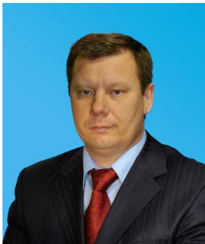
Депутат Тюменской областной Думы по избирательному округу № 12 город Ялуторовск; Исетский, Нижнетавдинский, Тюменский, Ялуторовский районы