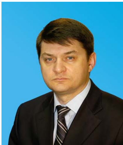
Депутат Тюменской областной Думы от Тюменского регионального отделения партии «Единая Россия»