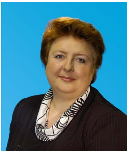
Депутат Тюменской областной Думы по избирательному округу № 13 город Тюмень