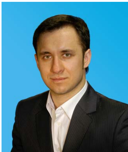
Депутат Тюменской областной Думы от Тюменского регионального отделения партии «Единая Россия»