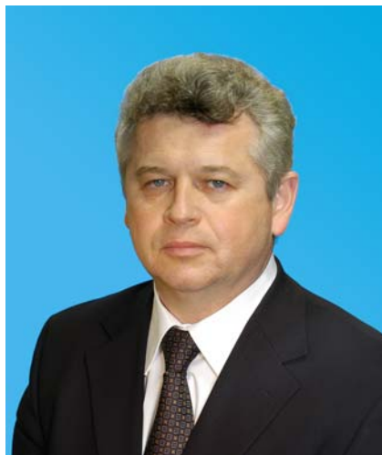
Депутат Тюменской областной Думы по избирательному округу № 10 город Нижневартовск