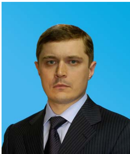
Депутат Тюменской областной Думы по избирательному округу № 15 город Тюмень