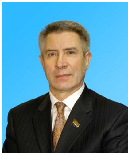
Депутат Тюменской областной Думы по избирательному округу № 5 города Урай, Югорск; Кондинский и Советский районы