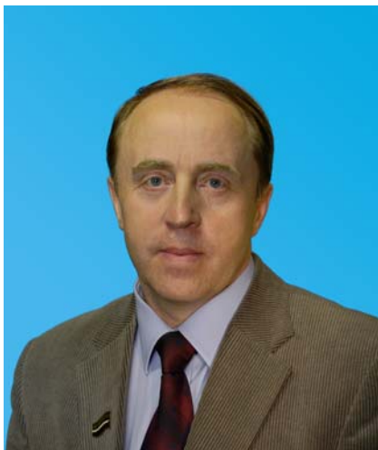
Депутат Тюменской областной Думы по избирательному округу № 16 города Заводоуковск, Ишим; Голышмановский, Ишимский, Омутинский районы