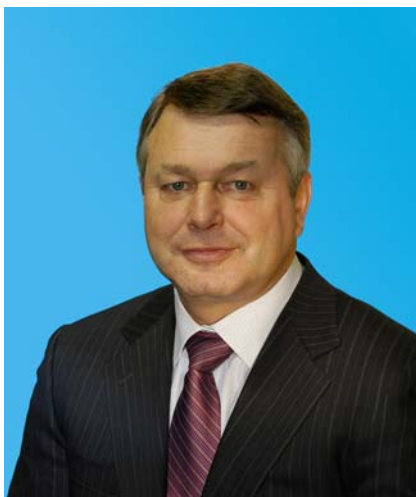
Депутат Тюменской областной Думы по избирательному округу № 7 город Сургут