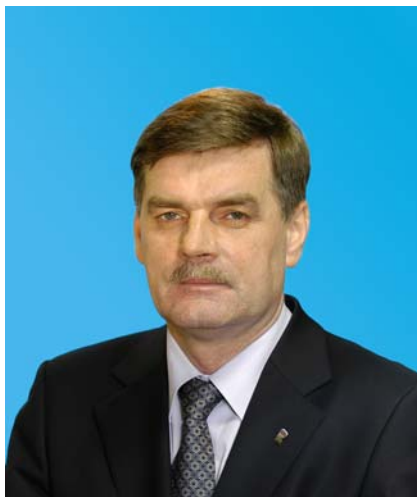
Депутат Тюменской областной Думы от Тюменского регионального отделения партии «Единая Россия»