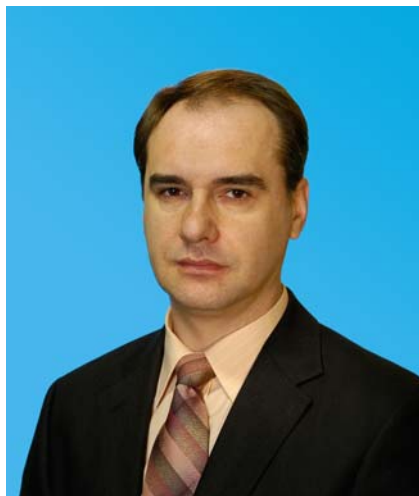
Депутат Тюменской областной Думы от Тюменского регионального отделения партии «Единая Россия»