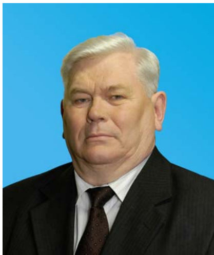
Депутат Тюменской областной Думы от Тюменского регионального отделения партии «Единая Россия»