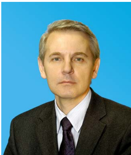
Депутат Тюменской областной Думы от Тюменского регионального отделения партии «Единая Россия»