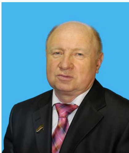
Депутат Тюменской областной Думы от Тюменского регионального отделения партии «Единая Россия»